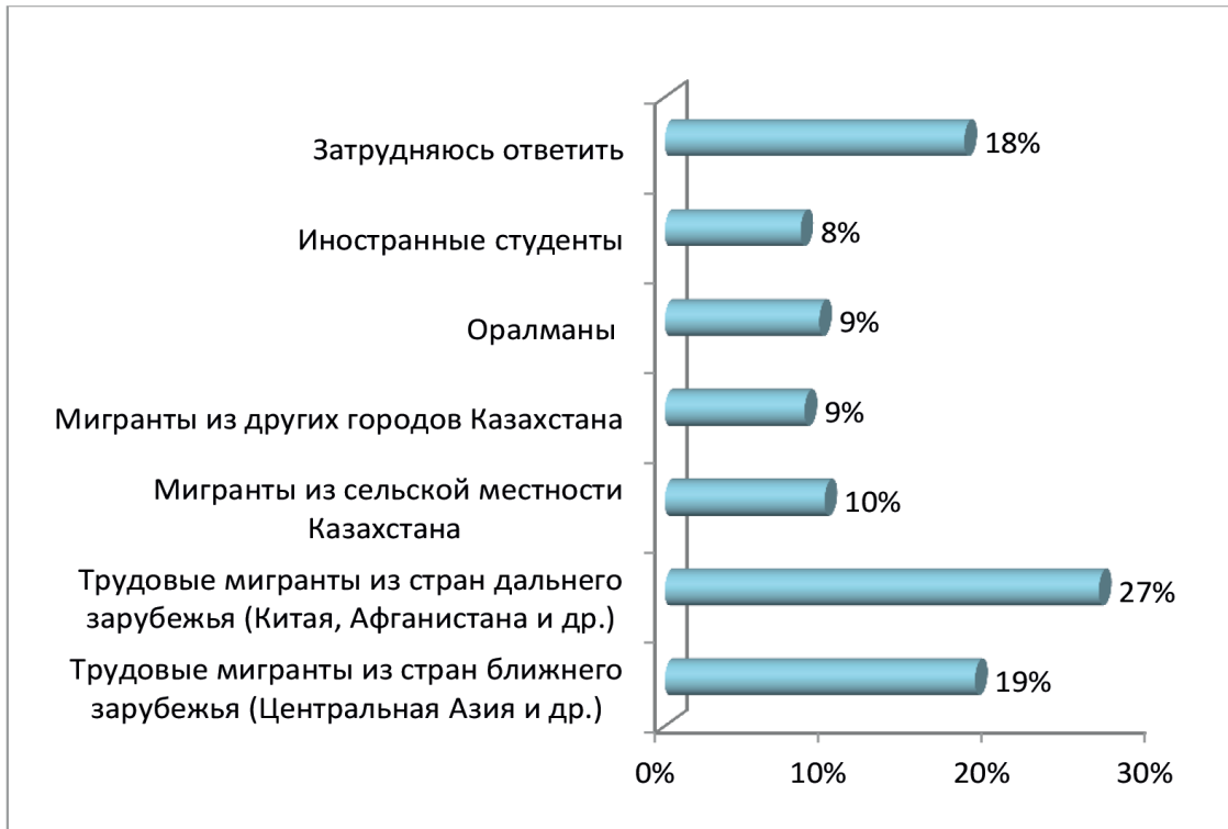
Диаграмма 3. Какие группы мигрантов вызывают у Вас наибольшие опасения и тревоги?

Миграция из других городов и сельской местности Казахстана представлена минимальными данными (в совокупности 19 %). Именно они составляют серьезную конкуренцию коренному населению столицы на рынке труда. Мировой опыт показывает, что хуже образованные, плохо подготовленные в культурно-психологическом отношении к жизни в большом городе, они становятся маргинальной группой и вносят элемент общей нестабильности в столичный социум (Killias & Lukash, 2019).