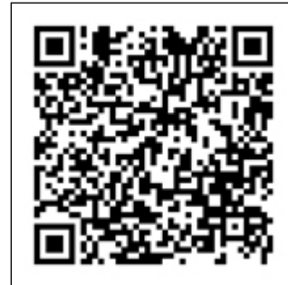
Рис. 5. Интерактивная экскурсия в музее ОРУД–ГАИ–ГИБДД с привлечением театра

Современная музейная работа в ОВД направлена на то, чтобы стать действующим механизмом культурного пространства, формировать имидж МВД России не только через экспонаты, но и через деятельность. Рациональное сочетание традиционных и интерактивных форм подачи материала позволяет привлечь посетителей, пробудить интерес к музейной экспозиции и воспитать у сотрудников вкус восприятия музейных экспозиций.