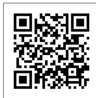
Рис. 4. Музейная экспозиция в Санкт-Петербургском университете МВД России

Проведение выставок является частью музейной работы. Выставки повышают доступность и общественную значимость музейных фондов, способствуют совершенствованию культурно-образовательной работы музеев, расширяют географию их деятельности.